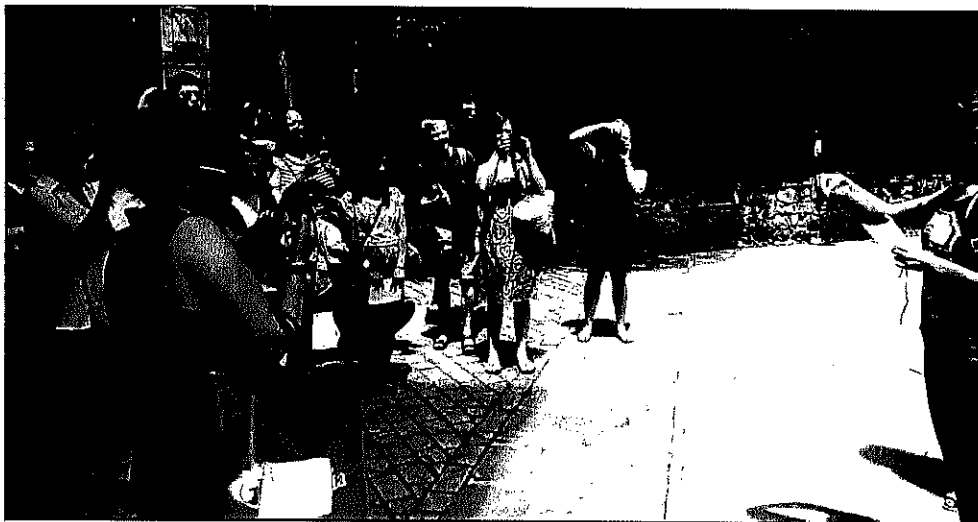
Se propone un plan de turismo asumible a largo plazo (4 años).

Téngase en cuenta que si no se hiciera el GGU habría 140 millones más. Por eso, es cuestión de opciones. En todo caso, también es una opción revisar la fiscalidad para esto y para el país, sabiendo que esas